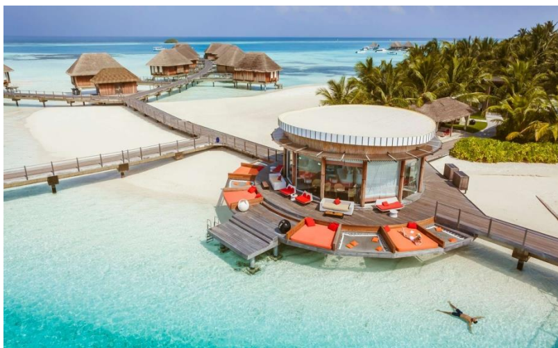
The Manta Lounge